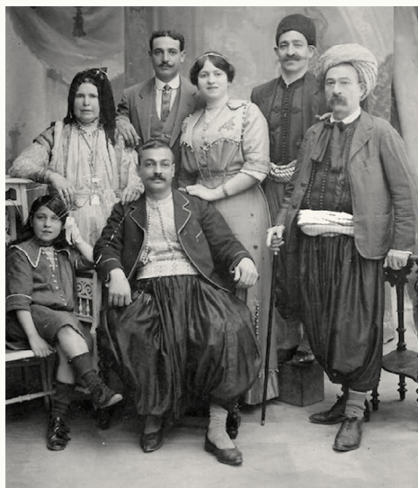
1914 FAMILLE ZAOUÏ