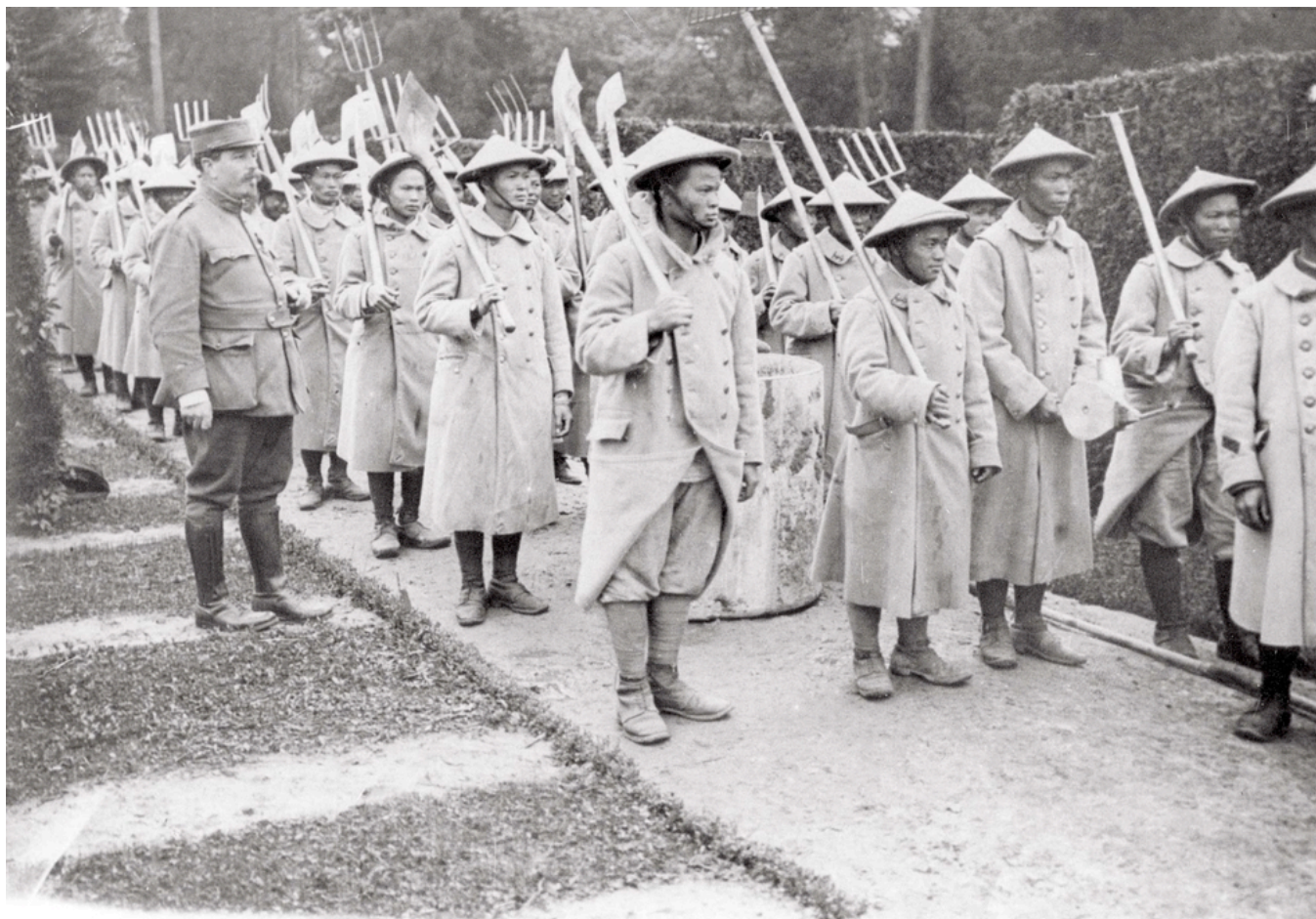
Ouvriers tonkinois encadrés par des soldats français le 26 mai 1917