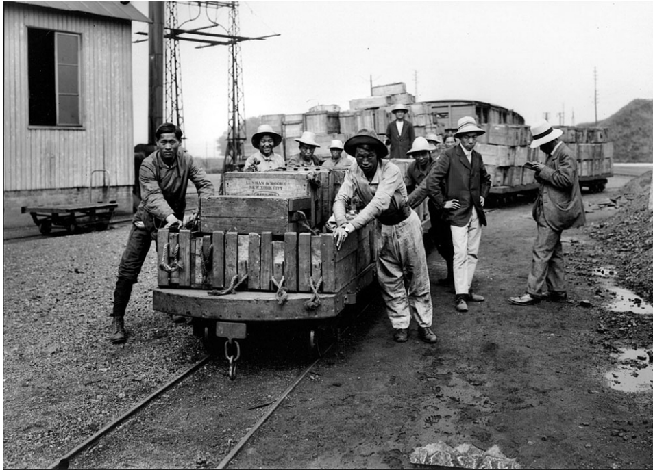
Guerre 1914-1918. Ouvriers chinois transportant des caisses de munition venues des États-Unis dans une gare française.

En conservant les principes méthodologiques mis en œuvre dans le cadre de cette séquence, on peut envisager un travail portant sur des objectifs identiques à partir d'autres documents-sources disponibles sur le site Internet du Musée de l'Histoire de l'immigration 4 , et notamment :