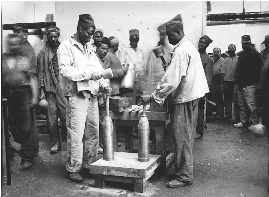
Guerre 1914-1918. "Les travailleurs coloniaux et étrangers dans nos manufactures de guerre", région de Lyon, mi-septembre 1916. Sénégalais chargeant les obus. Photographie parue dans le journal Excelsior du dimanche 17 septembre 1916.